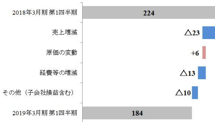
営業利益増減分析 (単位：億円)