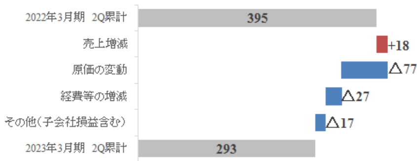
営業利益増減分析 (単位：億円)