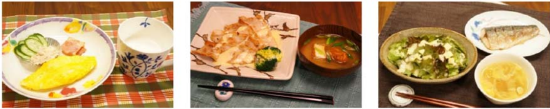
図1 ケトン食メニューの一例

(左)朝食:オムレツ*、ツナサラダ*、ベーコン、ケトンフォーミュラ、(中)昼食:豚肉ソテー*、みそ汁*、(右)夕食:サバの塩焼き、コンソメスープ*、チーズサラダ*。*には MCT を添加。