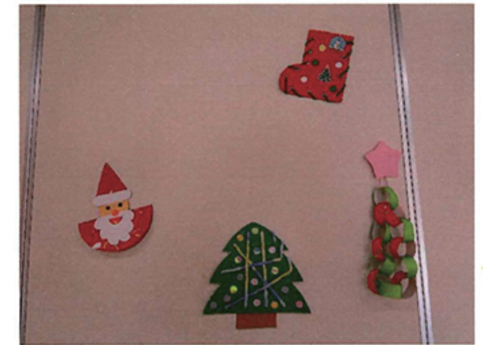
大府市発達支援センターおひさま職員一同