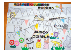
広島県 特定非営利活動法人 子ども・若者支援マイブレイス様