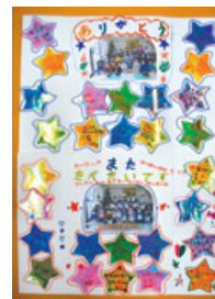
福島県 NPO法人 地域生活支援ネットOneOne様

寄贈先のみなさまより、温かいお気持ちが込められたお礼のお手紙や、その思いが表現された作品をたくさんお寄せいただきましたので、そのごく一部をご紹介します。ぜひご覧ください。