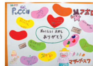
徳島県 指定放課後等デイサービス事業所 マザーゲース7様