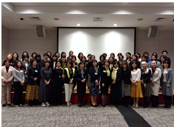
女性管理職ネットワーク交流会 参加者集合写真

D&Iの第一歩としての女性活躍推進については、トップのコミットメントのもと、女性社員の管理職への積極登用、アンコンシャスバイアス研修などを通じて、明治グループ一体での意識改革を推進しています。2023年3月には、国際女性デーに合わせてグループ合同の女性管理職ネットワーク交流会を開催し、女性役員や部長によるパネルディスカッションや座談会を行い、上級管理職への視座醸成・管理職パイプラインの構築につなげる取り組みとしています。